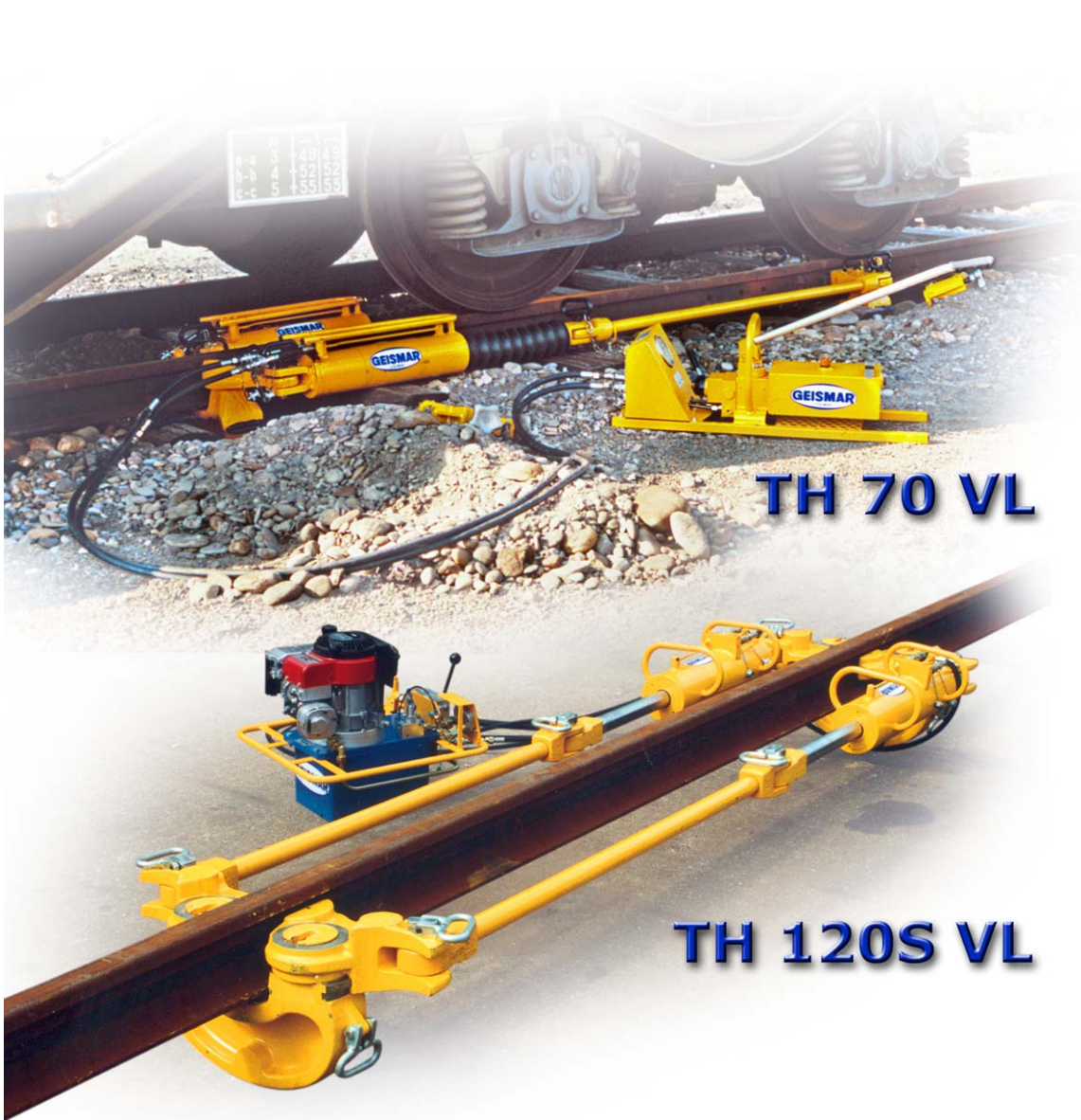
TH 70 VL